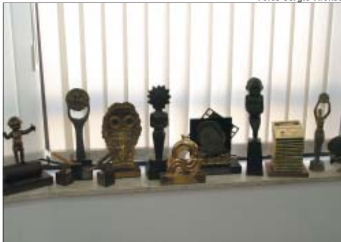
ALGUNS DOS troféus conquistados em mais de 50 anos de carreira