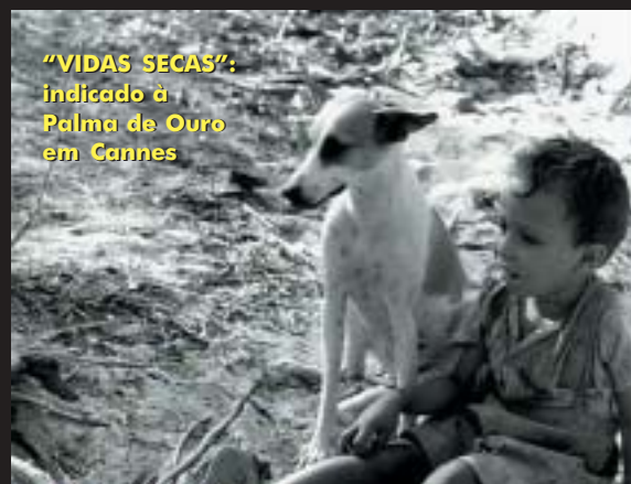
“VIDAS SECAS”: indicado à Palma de Ouro em Cannes