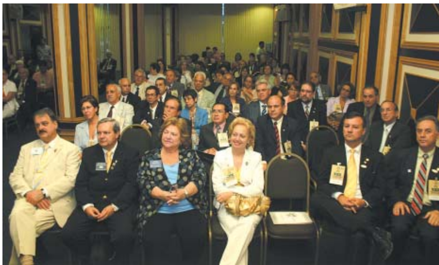
PARCIAL DA platéia na sessão de abertura do GETS