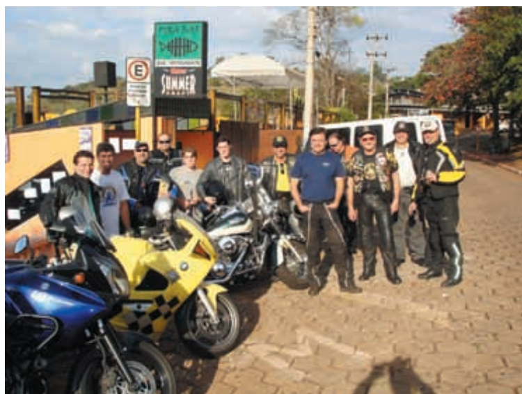
● REUNIÃO DO grupo na cidade de Piraju, em São Paulo