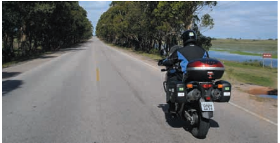
● NA ESTRADA: os rotacyclists organizam passeios por todo o país

A lição eles aprenderam com o Rotary: o poder da união é capaz de superar qualquer distância ou desafio. “Os motociclistas já são na-